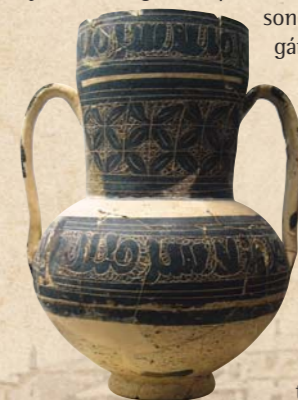
Jarrita esgrafiada musulmana S. XII

Aunque el actual asentamiento de la ciudad de Cehegín se produce en la Edad Media en base a una iniciativa islámica, hay que remontarse bastantes siglos atrás para profundizar en sus orígenes. Es un hecho probado que los abrigos y cuevas de Peña Rubia fueron aprovechados desde el Neolítico como lugares de enterramiento, perdurando como sagrada tradición durante varios siglos. Numerosos yacimientos arqueológicos dan testimonio del paso de las principales culturas prehistóricas y de la Antigüedad por estas tierras como lo