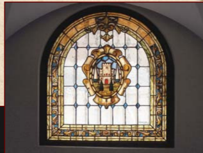
Vidriera a la entrada del Museo Arqueológico